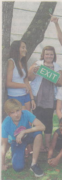
Trotz des ernststen Themas