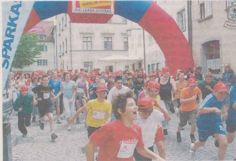
Am 7. Mai blüht Feldkirch ein wahres „LaufWunder“.