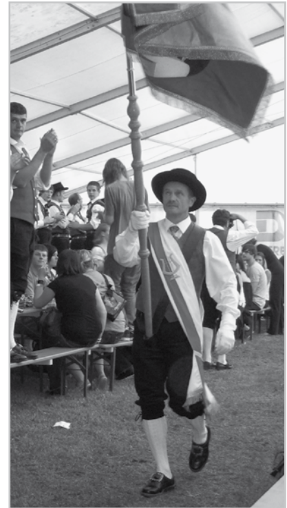
Hält die Schraube

Diese waren der Dämmerchoppen auf der Egg, der Frühschoppen der Buramusig beim Feldkircher Weinfest bei sicherlich über 30 Grad im Schatten, das dortige 2-stündige