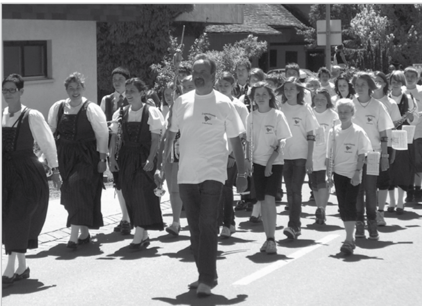
Aufmarsch der JUMU in Muntlix

Foto - ein bisschen zurückhaltend machte. In der Fahnenstange hatte er nämlich kurz vor dem Sternmarsch eine lockere Schraube entdeckt und traute der Konstruktion nicht mehr so ganz. Am darauffolgenden Tag ging's schon wieder weiter. Die Buramüsig (die immer noch so heißt)