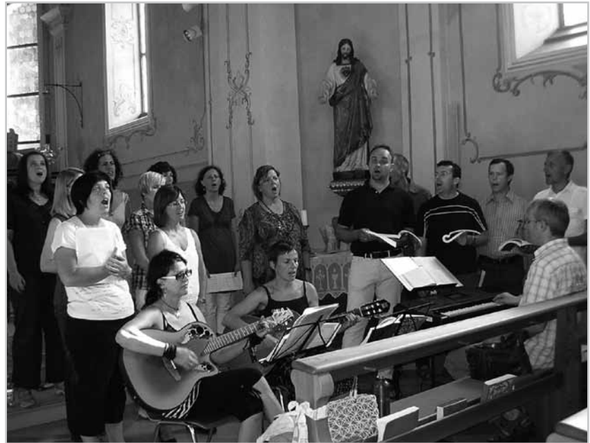
Die Patroziniumsfeier in Gurtis bildete den Abschluss der vergangenen Saison.

Bei den sonstigen Auftritten war die Gestaltung des Programmpunktes