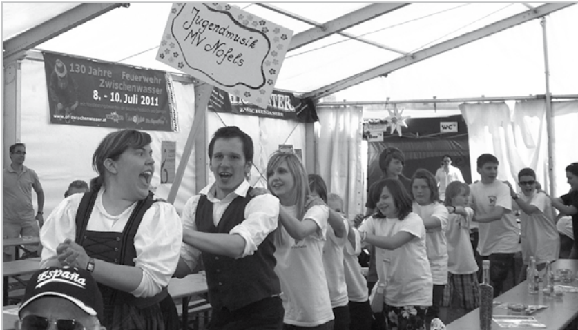
Polonese im Festzelt in Muntlix