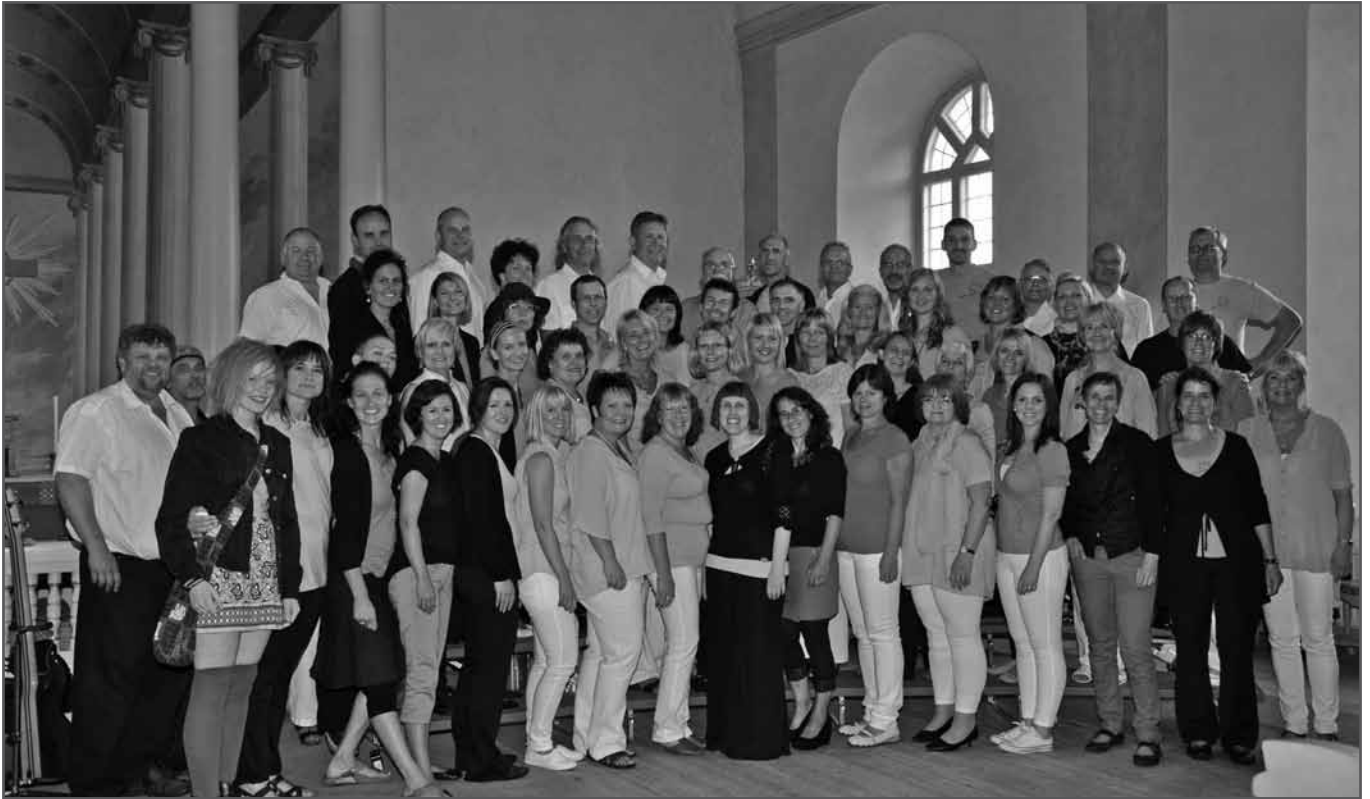
Der Gesundakör und das Nofler Chörle gaben ein gemeinsames Konzert auf der Insel Sollerö.