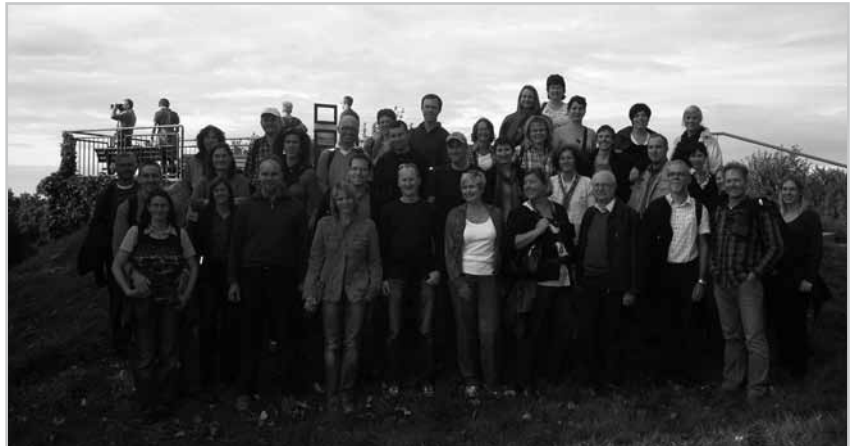
38 Personen waren beim gemeinsamen Ausflug auf die Insel Reichenau mit dabei.

Die Termine für die beiden Jubiläumskonzerte „25 Jahre Nofler Chörle“ wurden inzwischen fixiert. Am Sonntag, dem 10. April, um 18 Uhr bietet das