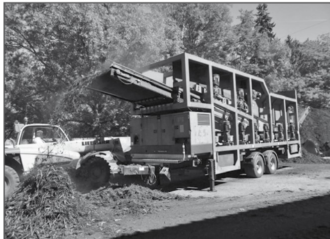
Verarbeitung der Grünabfälle am BLUGA-Platz

Am Samstag, den 10.11.2012 endet die heurige BLUGA-Saison und bietet den Mitgliedern die letzte Möglichkeit, ihre Grünabfälle zu entsorgen. Das abgelaufene Vereinsjahr kann als durchaus erfolgreich bezeichnet werden, ist doch bei den angelieferten und dadurch zu verarbeitenden Mengen gegenüber dem Vorjahr wieder eine Steigerung zu verzeichnen, wodurch wir aber in räumlicher Hinsicht bald unsere Kapazitätsgrenze erreicht haben werden. Traditionell findet an diesem Samstag auch ein gemütlicher Hock im kleinen Rahmen im BLUGA-Areal statt, bei dem wieder der Wurst- und auch der Glühmost-Kessel angeheizt werden.