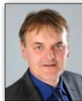
GEORG BUCHER Bürgermeister Gemeinde Bürs