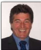
FRIDOLIN PLAICKNER Bürgermeister Gemeinde Bürserberg